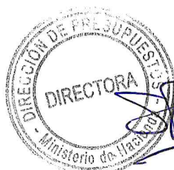
SERELI PARDO ZÚÑIGA

I.F. N°288/28.10.2024 I.F. N°040/24.01.2024 I.F. N°021/16.01.2024 I.F. N°001/02.01.2024 I.F. N°268/13.12.2023 I.F. N°211/28.09.2023