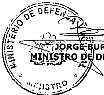
JORGE BURGOS VARELA MINISTRO DE DEFENSA NACIONAL